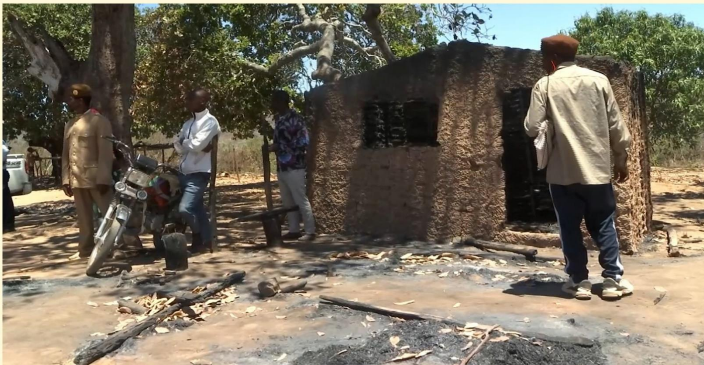
Terrorismo culmina com a destruição de casas

D ezenas de casas construídas com material precário foram incendiadas por terroristas na noite de 3 de Outubro, no posto administrativo de Chipene, distrito de Memba, província de Nampula. O ataque, ocorrido entre as 20h e 21h, deixou um rastro de destruição e medo entre os moradores locais.